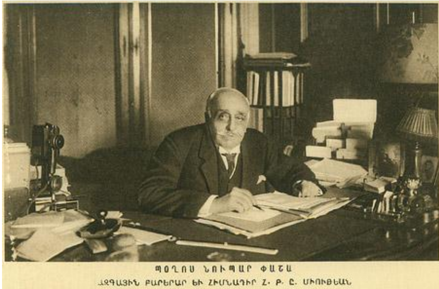
Président du Conseil National d'Arménie Occidentale Boghos Nubar Pacha