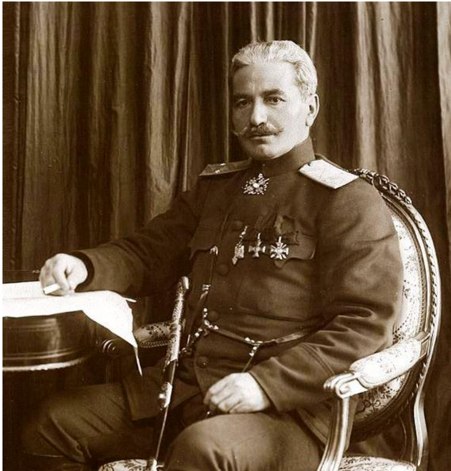
Commandant (Zoravar) Andranik