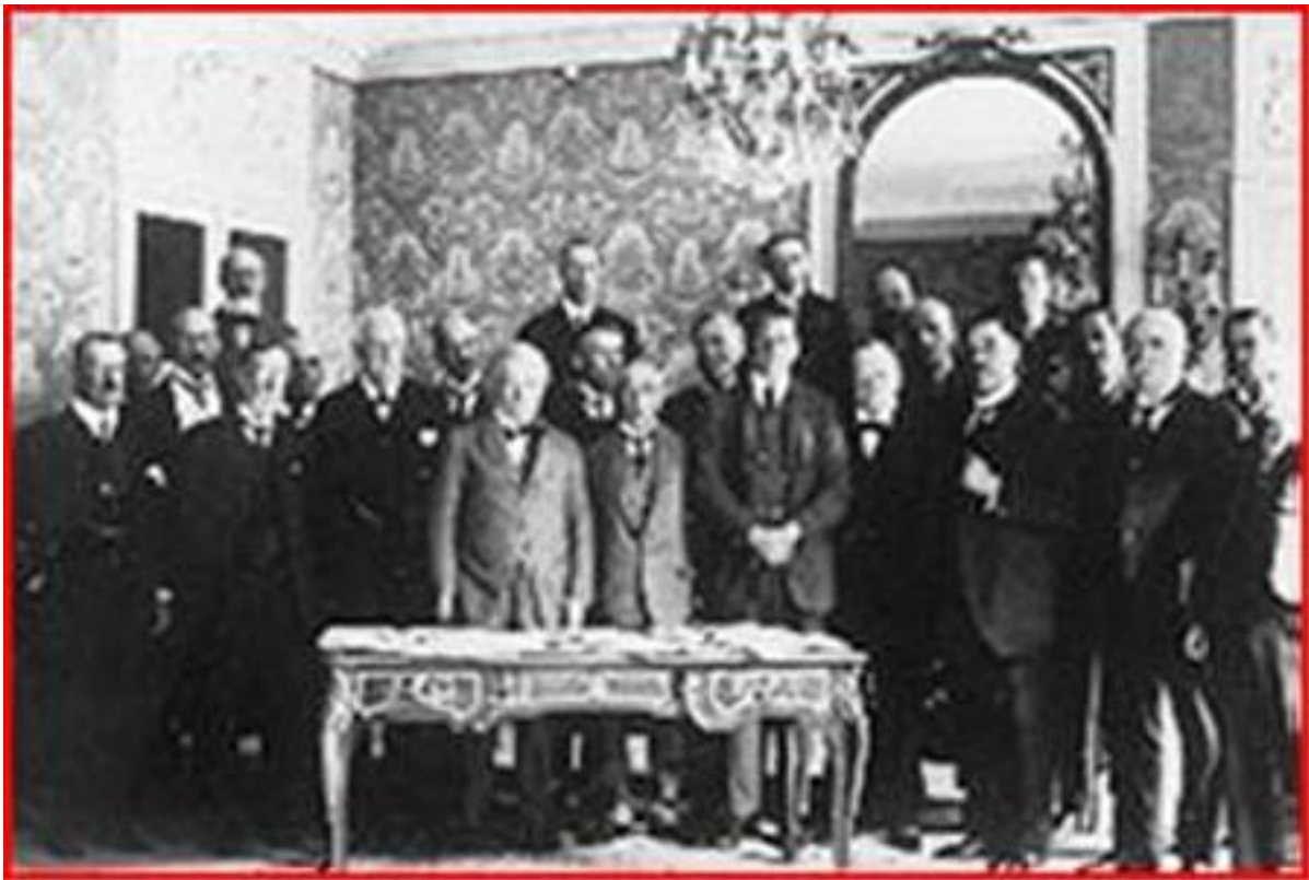
Membres participants au Traité de Paix de Sèvres