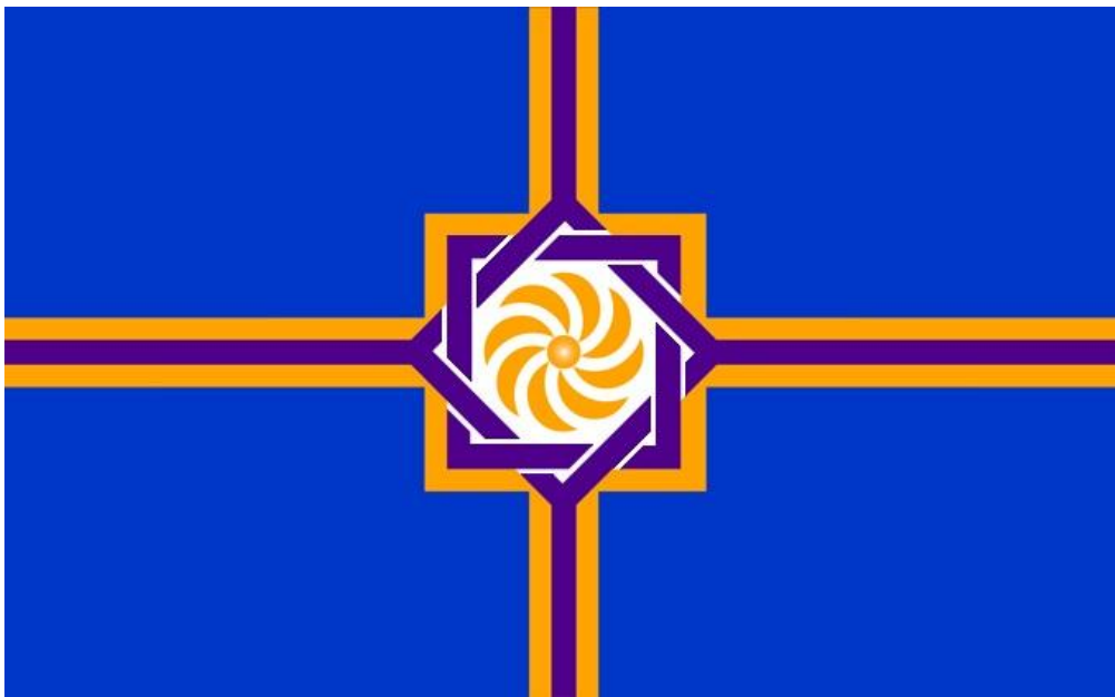
Drapeau de la République d'Arménie Occidentale