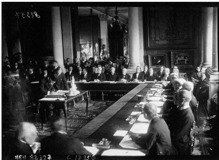
La délégation turque apposant sa signature au bas du Traité de Pais de Sèvres