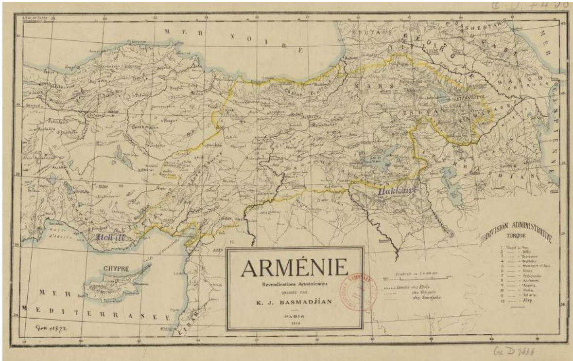
Carte ethnographique de l'Arménie