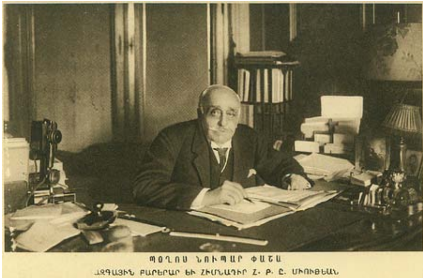
Արեւմտյան Հայաստանի Ազգային Խորհրդի Նախագահ Պողոս Նուբար Փաշա