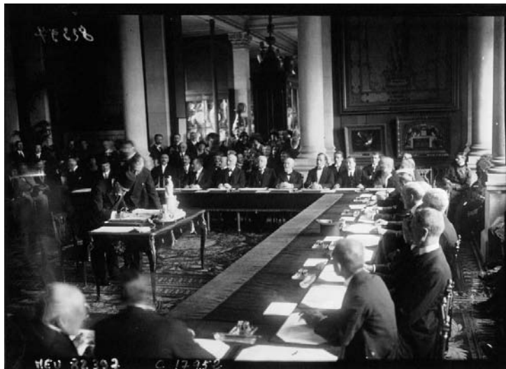
La délégation turque apposant sa signature au bas du Traité de Pais de Sèvres