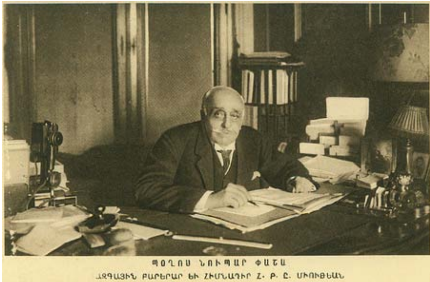
Président du Conseil National d'Arménie Occidentale Boghos Nubar Pacha