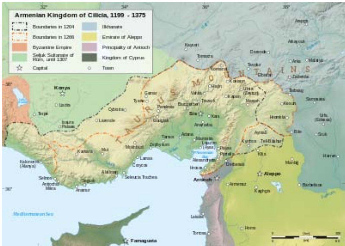
Carte de la Cilicie