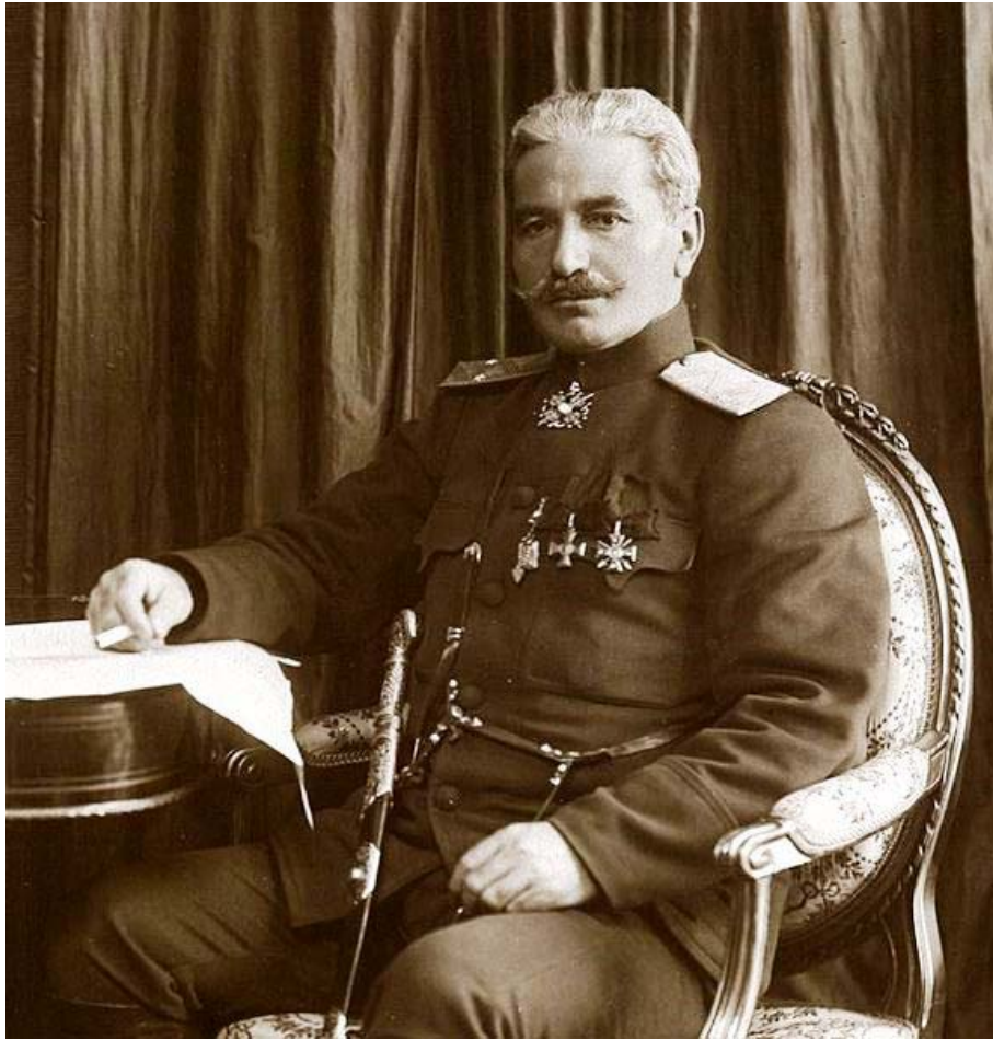
Commandant (Zoravar) Andranik