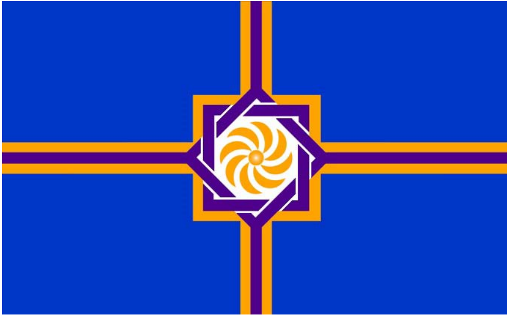
Drapeau de la République d'Arménie Occidentale (Arménie)